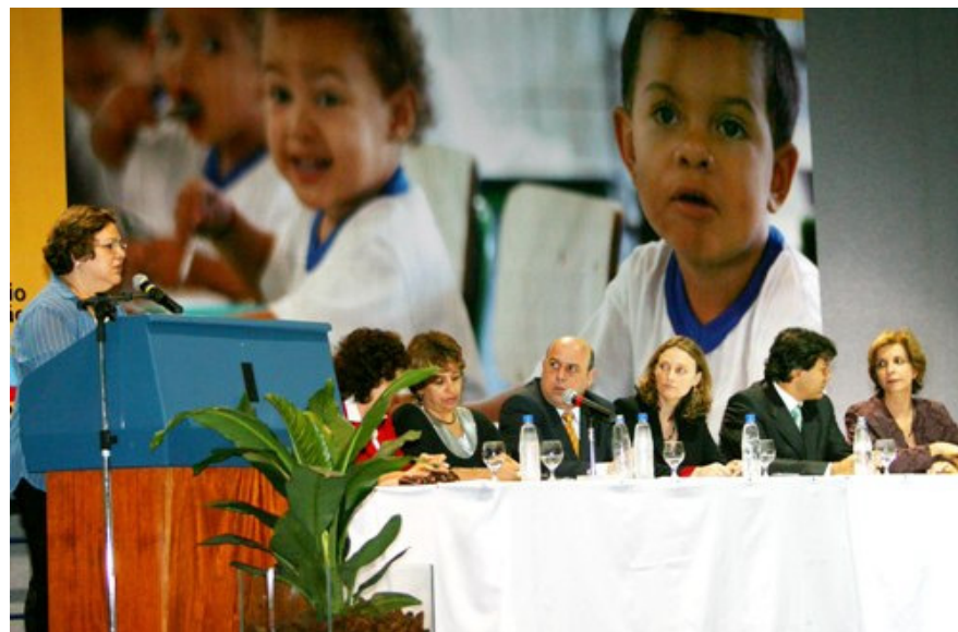
Assinatura do termo de adesão ao Plano de Desenvolvimento da Educação (PDE)