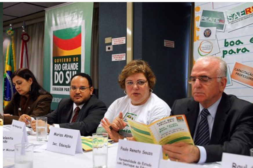
Primeira reunião do Comitê Estadual de Acompanhamento da Implementação do Plano de Metas do Compromisso Todos pela Educação