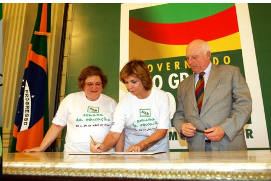
Assinatura do termo de adesão do Governo do Estado ao Movimento Todos Pela Educação