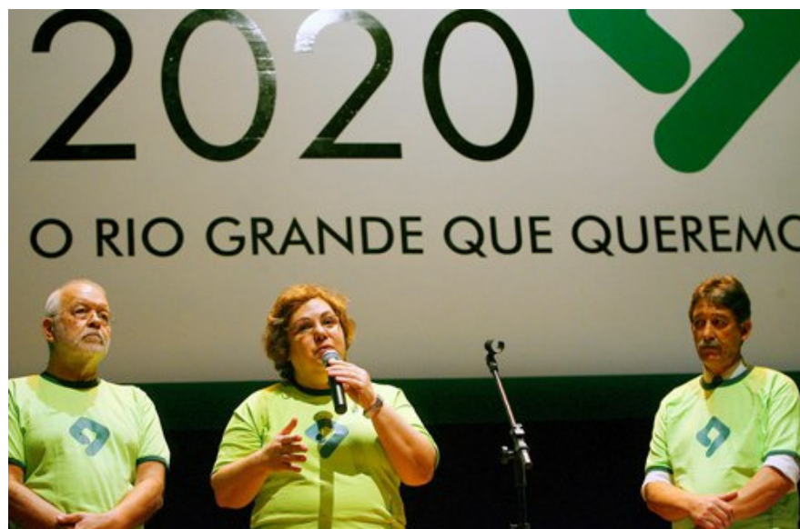
As ações da Secretaria da Educação estão sintonizadas com a Agenda 2020